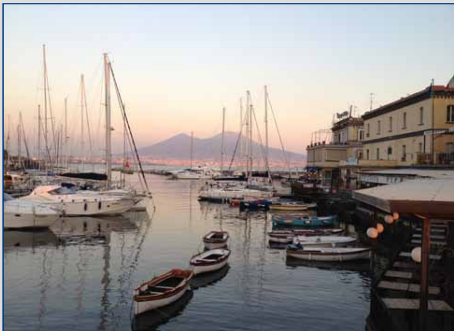
...I colori di Napoli da Castel dell'Ovo al Vesuvio...